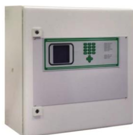
CONTROL PANEL (MULTISCAN ++MED)